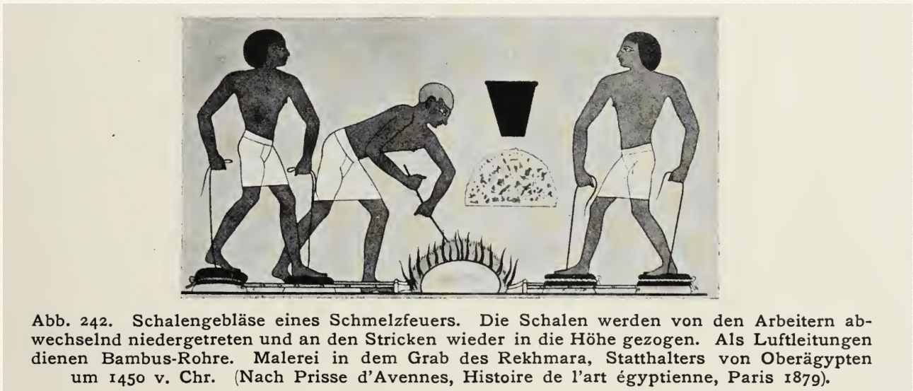
Abbildung aus 2.)

Weiterhin beschäftigten sich die Digidags im Heft ab Seite 15 mit einer Alarmanlage.