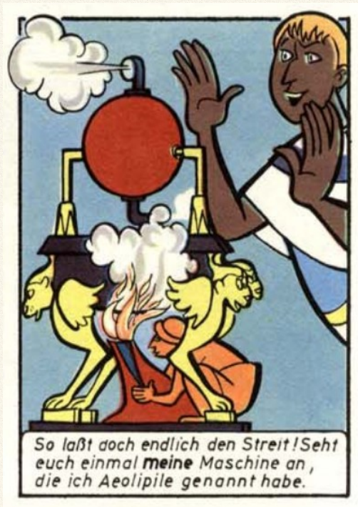
Heron's Dampfball, Seite 4