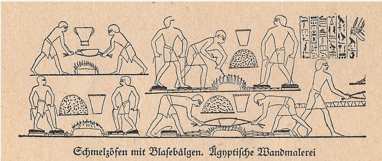
Abbildung aus 1.)