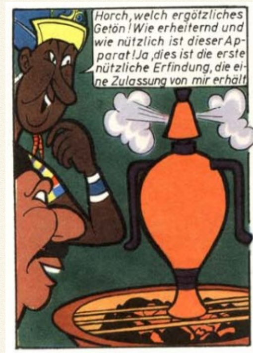
Ktesibios Dampfessel, Seite 12