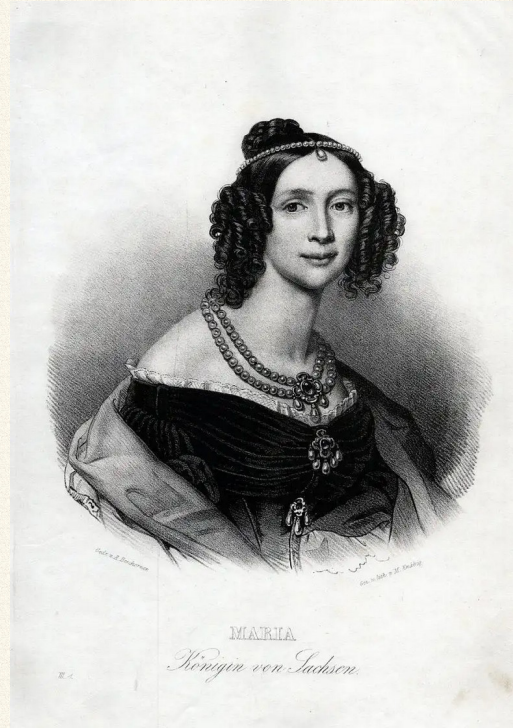
Königin Maria , und der nach Ihr benannte Raddampfer.