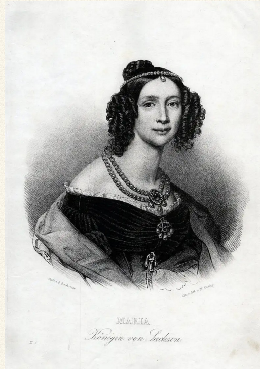
Königin Maria , und der nach Ihr benannte Raddampfer, auf einer alten Postkarte.